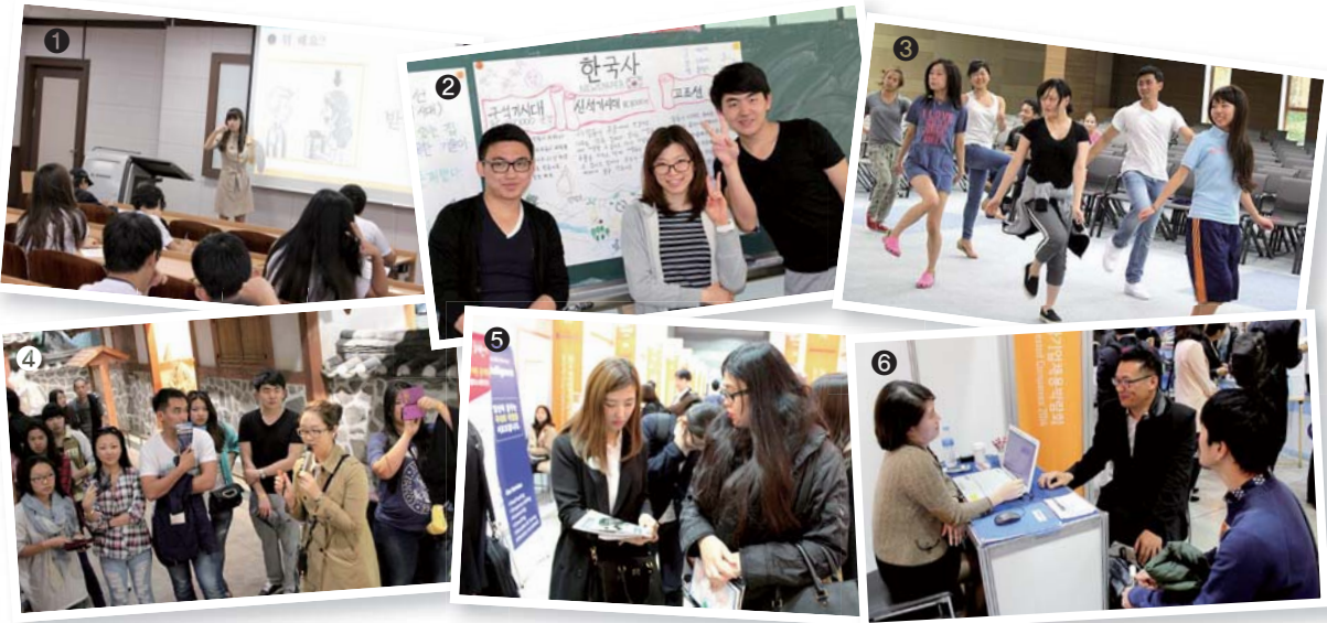
재외동포 모국수학교육과정 운영 관련 사진 자료

①한국어 수업, ②한국사 수업, ③한국문화 수업, ④현장학습, ⑤취업특강, ⑥취업박람회 참가